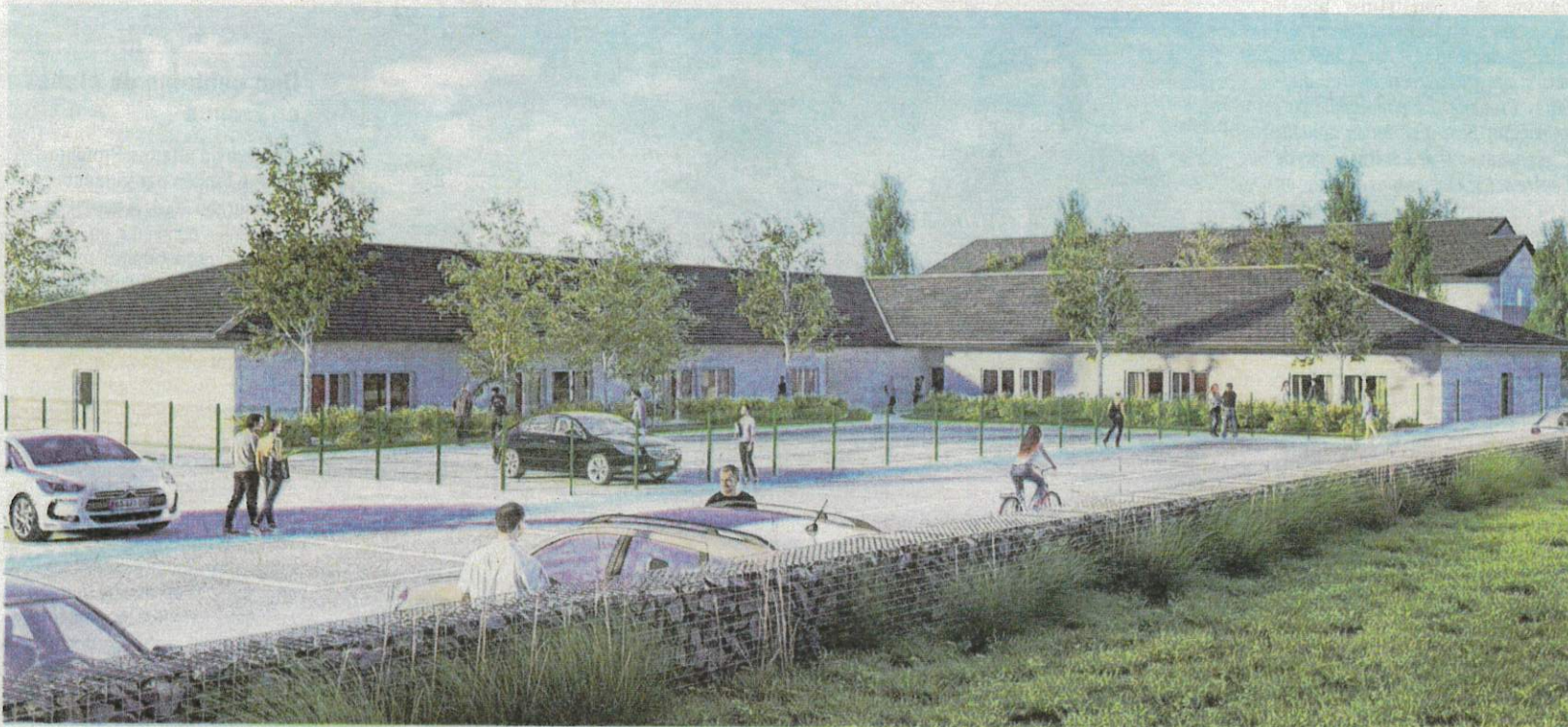
La nouvelle résidence Le Vallon des Vouas fonctionnera sur le principe d'un habitat partagé pour seniors privilégiant l'entraide, le maintien de l'autonomie et la vie sociale.

Juste à côté de l'école primaire du Lyaud, une résidence autonomie flambant neuve ouvrira au printemps. Elle accueillera 24 personnes âgées pour une vie en communauté. Présentation.